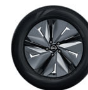
19" lichtmetalen velgen met aero cover