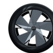
20" lichtmetalen velgen met aero cover