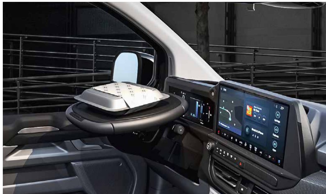
Afgebeeld: Mobile Office Pack