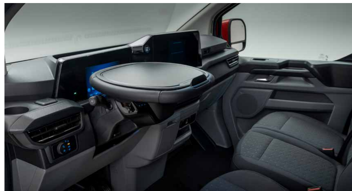
Afgebeeld: Mobile Office Pack