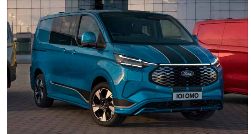
Grille wijkt af van afbeelding