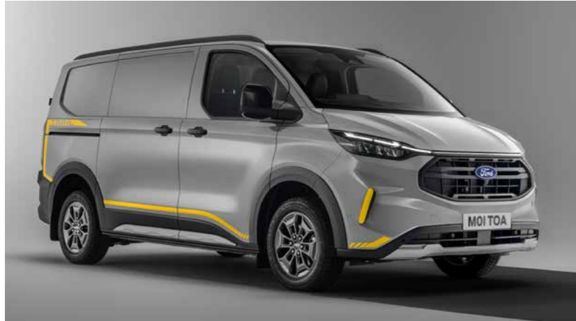
Dakrails zijn niet beschikbaar