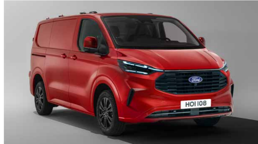
Velgen zijn optioneel