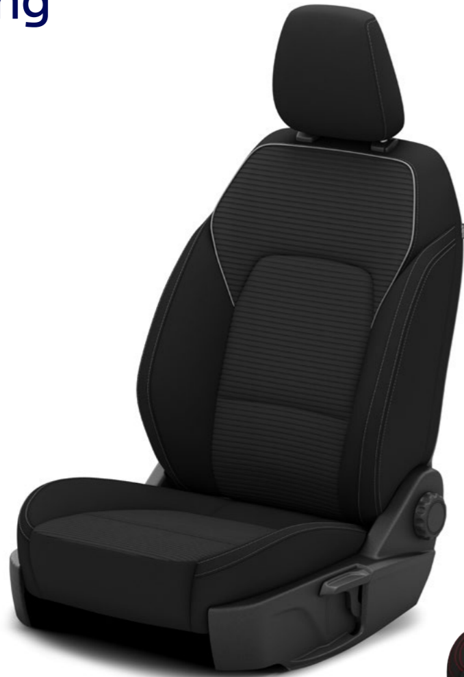
Bekleding Ray/Eton met Metal Grey stiksels, standaard op Titanium