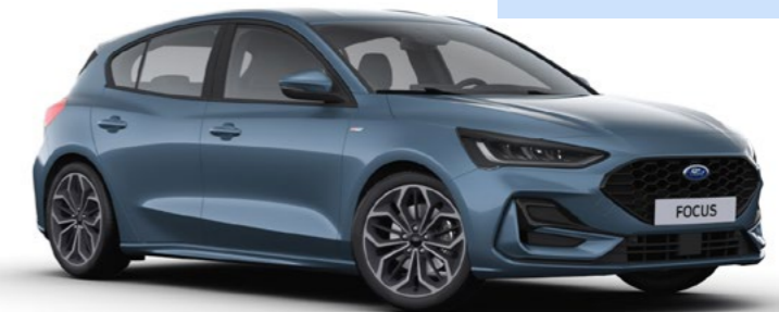
Premium metaallak Chrome Blue