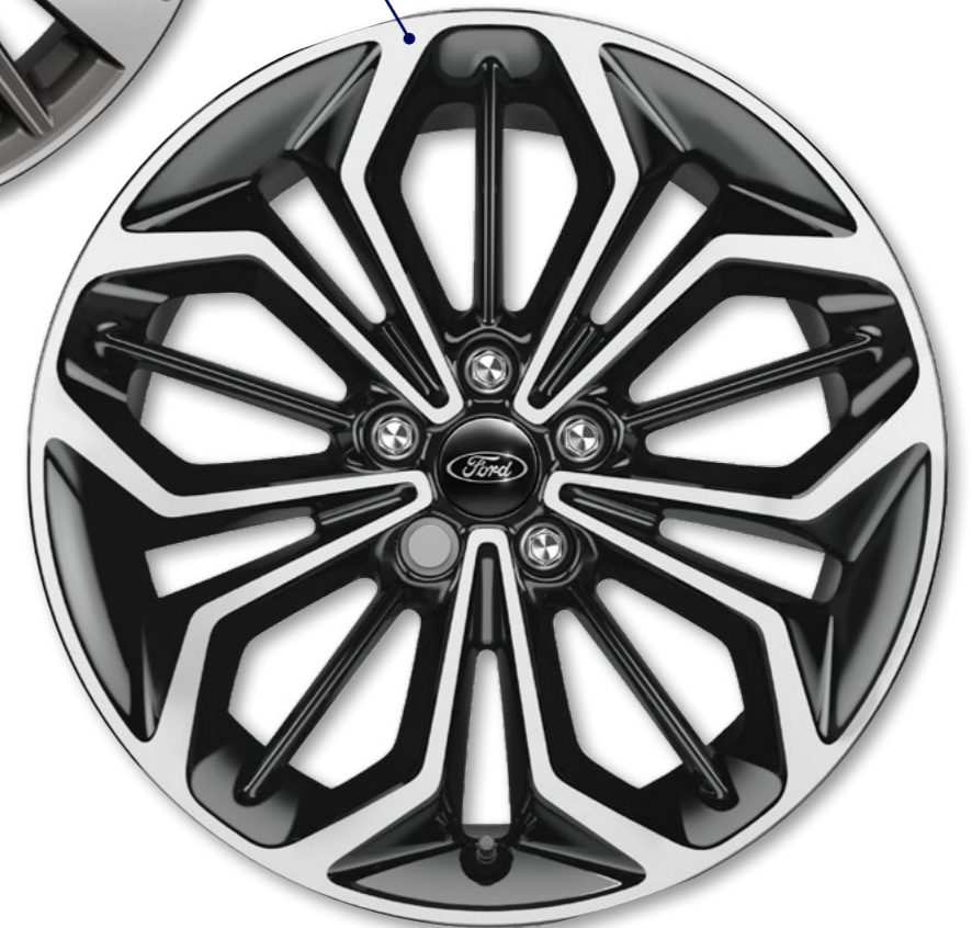
18 inch lichtmetalen velgen, 5x3-spaaks in High Gloss Black/Machined