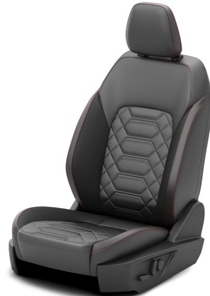
Bekleding Volledig Sensico met Generic Red stiksels, optioneel op ST-Line X