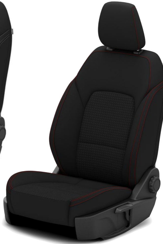
Bekleding Foundry/Eton met Generic Red stiksels, standaard op ST-Line en ST-Line X