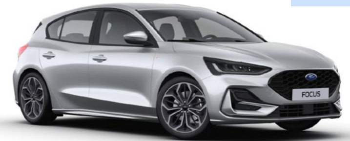
Metaallak Moondust Silver