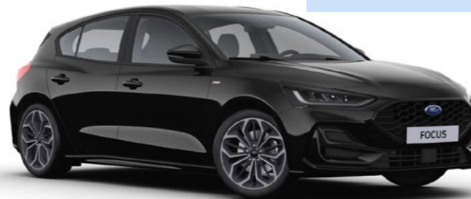
Premium metaallak Agate Black