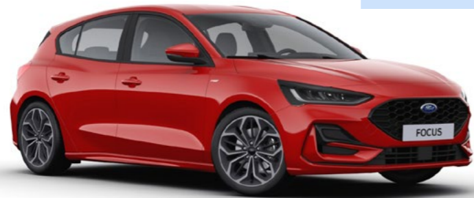
Standaard lak Race Red