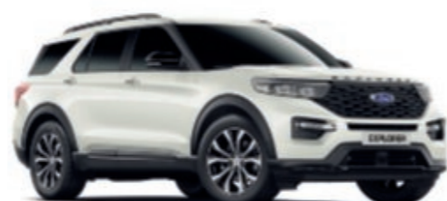
Star White Tri-Coat metallic carrosseriekleur*

*Metallic carrosseriekleuren zijn als optie tegen meerprijs leverbaar. **Carrosseriekleur niet leverbaar op ST-Line. De Explorer wordt 12 jaar lang gedekt door de Ford Perforation Warranty (garantie tegen doorroesten) vanaf de datum van eerste registratie. Afhankelijk van algemene voorwaarden. N.B.: De gebruikte afbeeldingen van de auto dienen alleen ter illustratie van carrosseriekleuren en geven niet de betreffende specificatie of productbeschikbaarheid in bepaalde markten weer. Kleuren en bekledingen in deze brochure kunnen - als gevolg van beperkingen van het gebruikte drukproces - van de werkelijke kleuren afwijken.