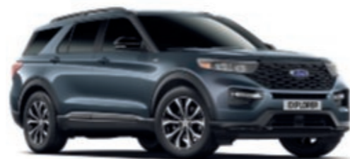
Infinite Blue Metallic carrosseriekleur*