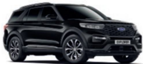
Agate Black Metallic carrosseriekleur*