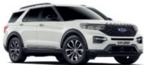
Oxford White † Effen carrosseriekleur