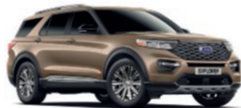
Stone Grey ** Metallic carrosseriekleur*