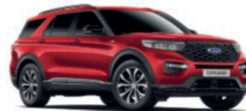
Lucid Red Getinte transparante metallic carrosseriekleur*