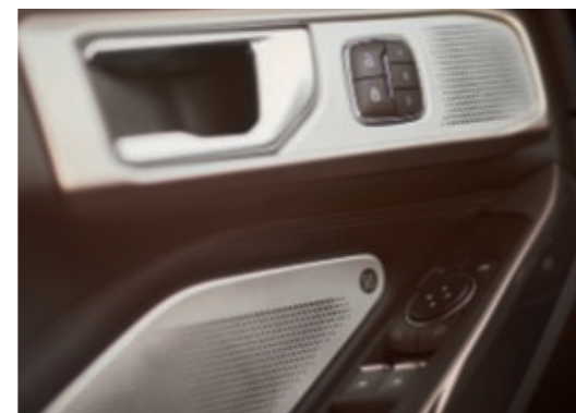
B&O Sound System met 14 luidsprekers en subwoofer.