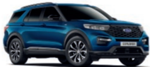
Atlas Blue † Metallic carrosseriekleur*