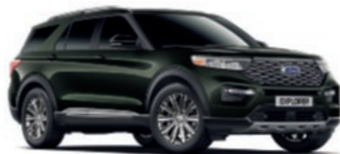
Forged Green *** Metallic carrosseriekleur*