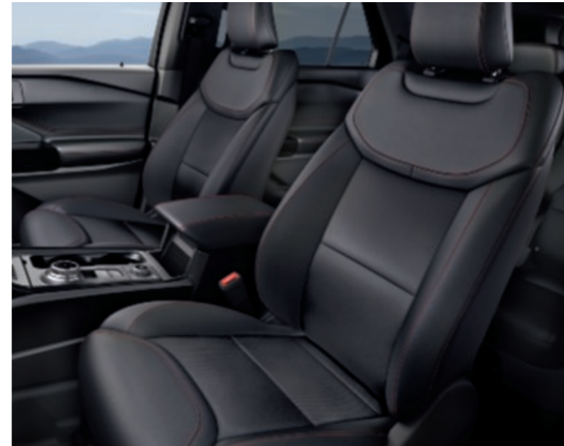
Salerno leder in Ebony met micro-perforatie en rood detailstiksel (standaard op ST-Line)

Verfijning en vakmanschap komen prachtig samen in de nieuwe Ford Explorer. Het uiterlijk en de uitstraling van de eerste klas materialen zullen jouw waardering voor het royaal bemeten interieur vergroten, of je nou als passagier meerijdt of zelf achter het stuurwiel zit.