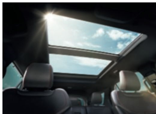
Elektrisch bedienbaar uit twee panelen bestaand panoramadak.