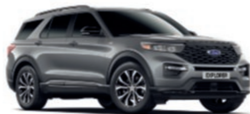
Carbonized Grey Metallic carrosseriekleur*