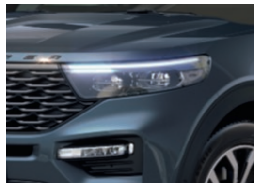
Led-koplampen met sportieve donkere behuizing.