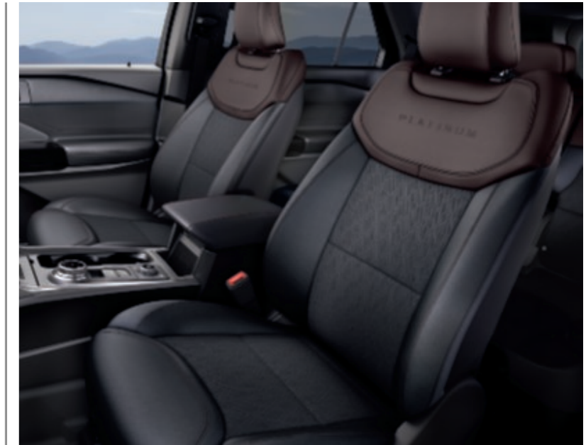
Geneva leder in Ebony, met Triangle Diamond perforatie en Brunello bovenzijde (standaard op Platinum, niet leverbaar in Nederland)

Salerno leder in Ebony met Enhanced Micro-perforatie en rode stiksels.